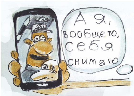
Автор: Максим Ерохин

В октябре вступил в силу новый регламент для сотрудников ГИБДД. К чему нам быть готовыми при общении с инспекторами на дороге?