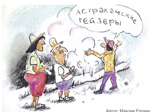
Автор: Максим Ерохин